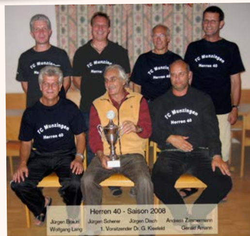
Die Meisterschaft Jungsenioren 2008