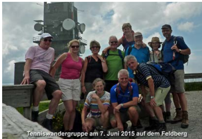
Tenniswandergruppe am 7. Juni 2015 auf dem Feldberg 2015, zweiter Versuch am Feldberg