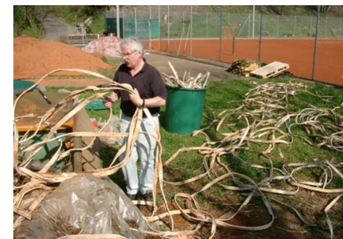
Die alten Linien werden entsorgt

wässert, erhielt der Platz Stück für Stück seine perfekte Spielqualität zurück. Um die notwendige Härte zu erreichen, wurden die Plätze mit viel Sorgfalt gewässert und mit dem Spezialgerät „Court-fix“ abschließend geglättet – ein zeitaufwändiger, aber entscheidender Schritt.