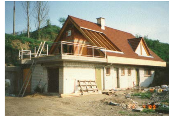
Der Rohbau neues Clubheim steht

Als erstes Clubheim diente eine einfache Bauhütte, die auf dem Platz vor der heutigen Garage stand. Trotz einfacher Ausstattung wurde hier das Vereinsleben gepflegt – mit vielen geselligen und unvergesslichen Clubabenden.