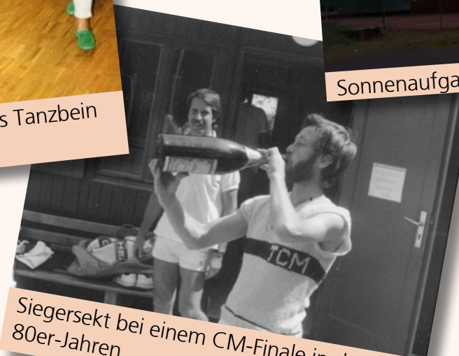
Siegersekt bei einem CM-Finale in den 80er-Jahren