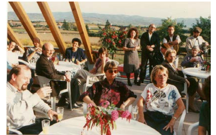
1995 Einweihung des 4. Platzes

Das 20-jährige Jubiläum wurde 1995 mit einem Schaukampf anlässlich der Einweihung des 4. Tennisplatzes gefeiert.