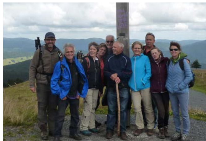
2016, eine sehr anstrengende Belchenwanderung