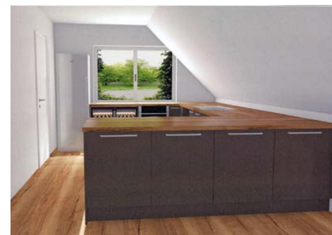
2023 die neue Küche im Clubheim