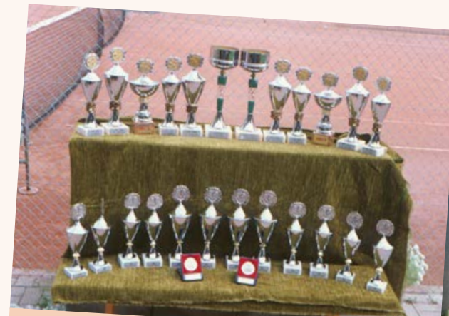
In den 80-er Jahren gab es bei den Club- meisterschaften viele Pokale zu gewinnen