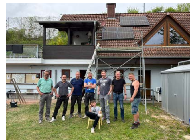
2025 die neue Balkon Photovoltaikanlage auf dem Dach des Clubheims