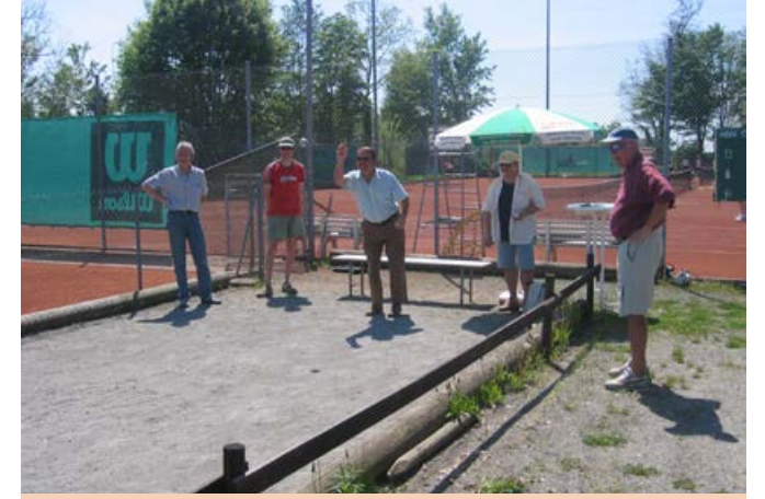
2002, Feierabend auf der neuen Bouleanlage