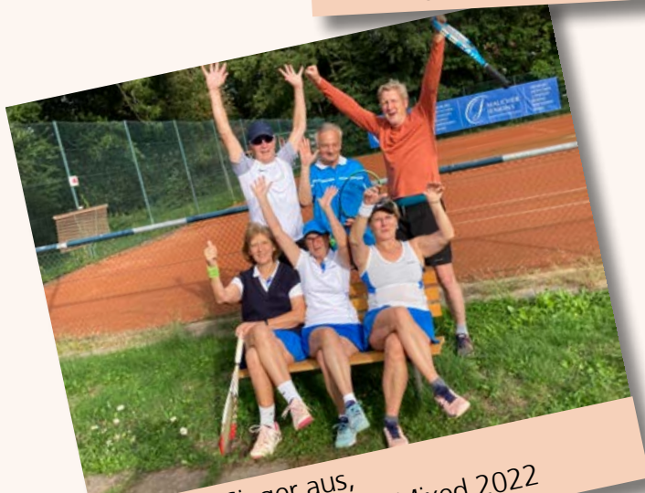
So sehen Sieger aus, die Meisterschaften im Mixed 2022