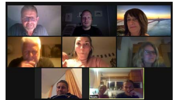
Vorstandssitzung digital über „Zoom“