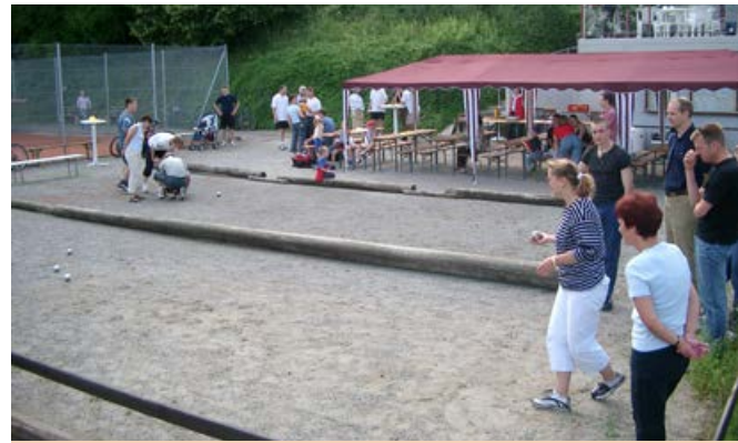
2002 die Bouleanlage wird eingeweiht mit einem Turnier.

Im Jahr 2002 wurde auf dem Parkplatz eine Bouleanlage errichtet, und zum 30-jährigen Jubiläum