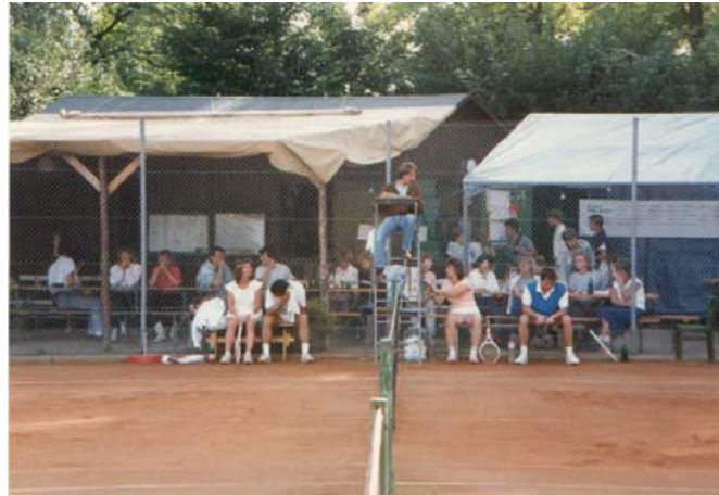
1978 erstes Vereinsheim, eine ehemalige Bauhütte