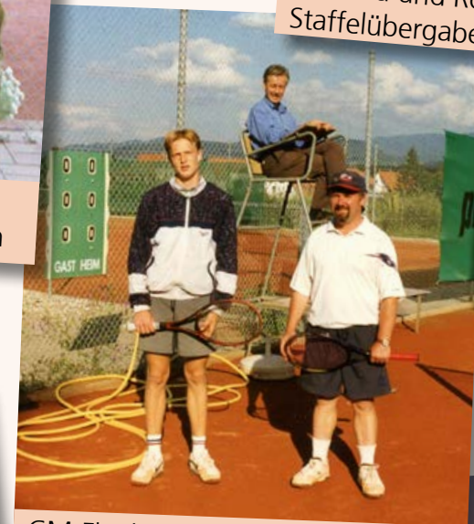
CM-Finale 1999 mit Oberschiedsrichter