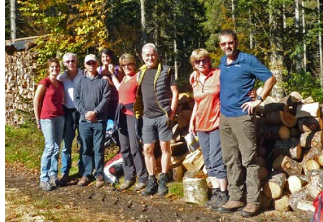
2014, Am Ibacher Kreuz