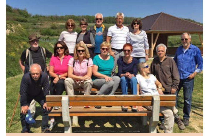
2019, Maiwanderung am Kaiserstuhl