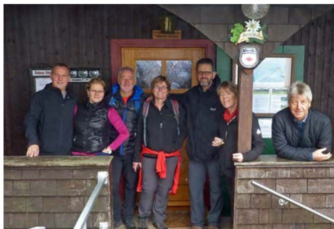
2015, in kleiner Besetzung beim Berglusthaus in St. Ulrich