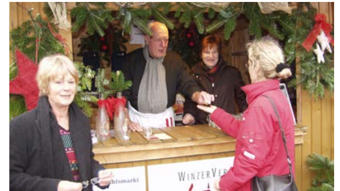
Am Glühweinstand auf dem Weihnachtsmarkt