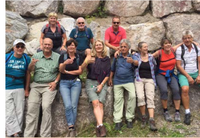
2017, kühlende Ravennaschlucht