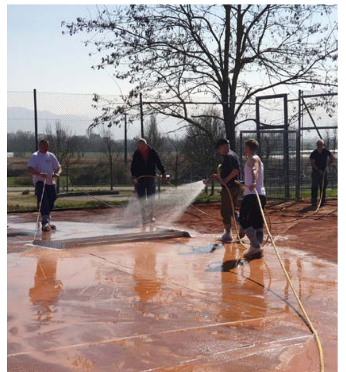
Die Plätze werden eingeschlämmt