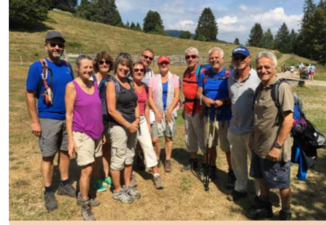
2018, Im Schwarzwald rund um den Nonnenmattweiher zur Kälbelescheuer