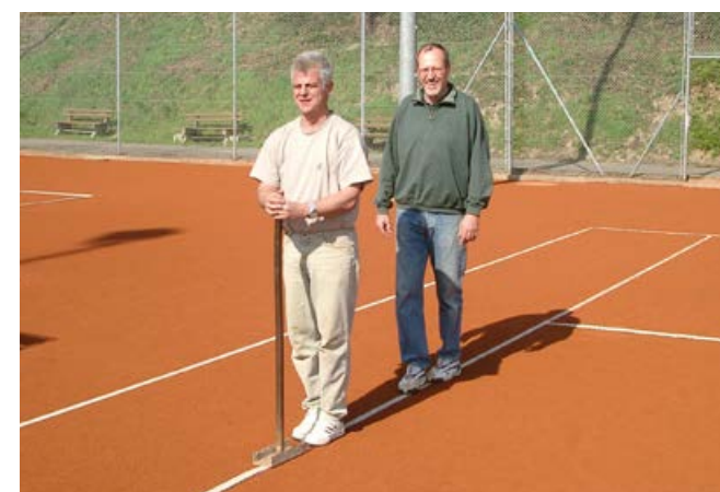
Die Linien werden gestampft.

Seit zwei Jahren liegt diese wichtige Aufgabe nun in den Händen eines professionellen Fachbetriebs. Durch moderne Technik und fachliches Know-how erfolgt die Platzaufbereitung nun noch schneller, effizienter und auf höchstem Qualitätsniveau. Das Ergebnis: optimal bespielbare Plätze, die sowohl Hobbyspieler als auch Mannschaften begeistern – bereit für eine erfolgreiche und verletzungsfreie Saison!