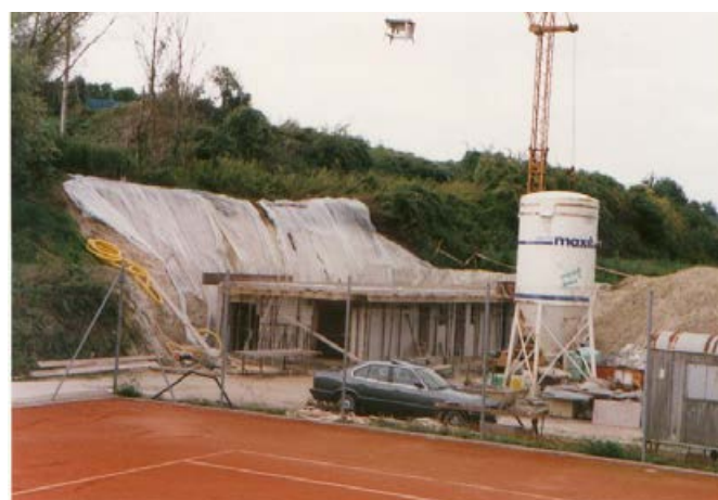
1988 das neue Clubheim entsteht