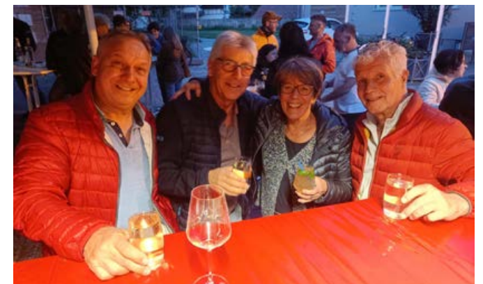
Am Schorlestand auf dem Wochenmarkt in Munzingen

Der Tennisclub Munzingen engagiert sich zudem aktiv in der Dorfgemeinschaft: Ob Weihnachtsmarkt, Fasnacht oder der wöchentliche „Schorlestand“ am Wochenmarkt – viele helfende Hände aus dem Club tragen zum lebendigen Miteinander im Ort bei.