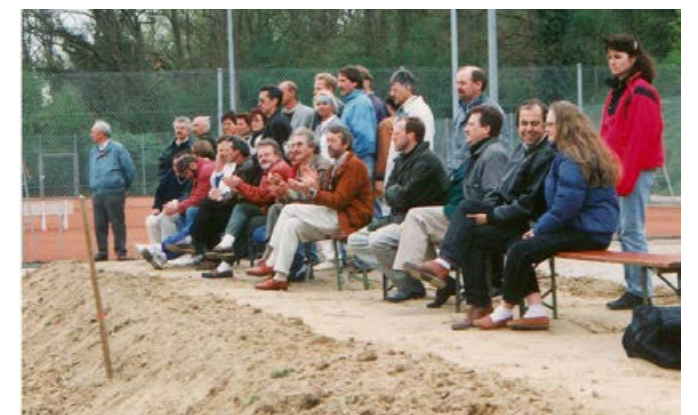
1995 Zuschauer beim Schaukampf auf Platz 4