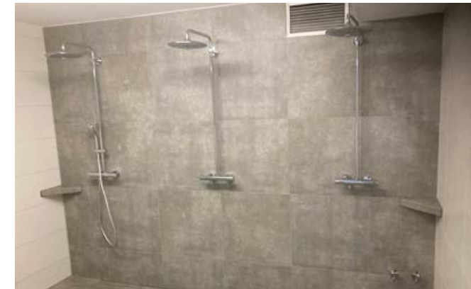
2022 Duschraumsanierung – Ausschnitt aus der Herrendusche

Wir gratulieren dem Tennis Club Munzingen zum 50jährigen Jubiläum!