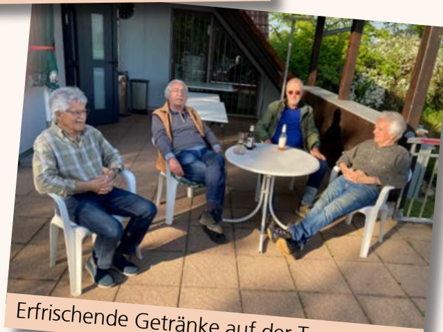
Erfrischende Getränke auf der Terasse