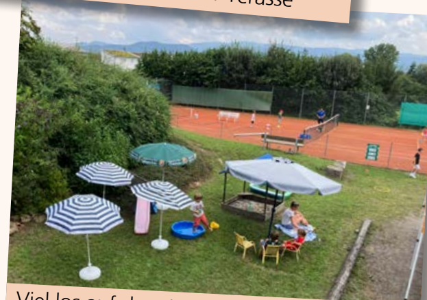
Viel los auf dem Kinderspielplatz beim Sommerfest 2024