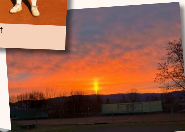
Sonnenaufgang 2025 über dem Platz