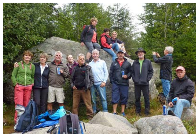
2015, tolle Wanderung in den Vogesen