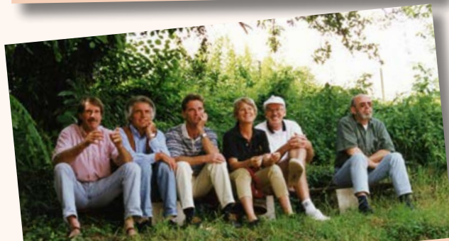
Eine Tribüne zu bauen am Hang war schon immer ein Traum