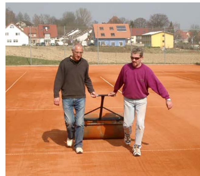
Der glattgezogene Sand muss mehrfach gewalzt werden

wässert, erhielt der Platz Stück für Stück seine perfekte Spielqualität zurück. Um die notwendige Härte zu erreichen, wurden die Plätze mit viel Sorgfalt gewässert und mit dem Spezialgerät „Court-fix“ abschließend geglättet – ein zeitaufwändiger, aber entscheidender Schritt.