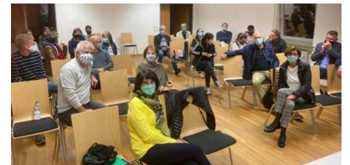
2020 Mitgliederversammlung unter Coronabedingungen

2020 brachte die Corona-Pandemie das Vereinsleben zum Erliegen. Nur unter strengsten Auflagen war Tennisspielen im Freien erlaubt. Die Mitgliederversammlung 2021 konnte nur mit Masken und Abstand stattfinden, Vorstandssitzungen wurden digital per Zoom abgehalten.