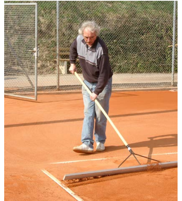
Der Sand wird glatt gezogen

In den vergangenen Jahren waren es oft engagierte Mitglieder, die mit über 150 Stunden Eigenleistung die Vorbereitung übernahmen. Zunächst wurde der alte Sand – rund 12 Tonnen – abgetragen und entsorgt. Dabei hieß es: Ärmel hochkrempeln, anpacken und gemeinsam etwas schaffen. Im Anschluss wurden die Spielfeldlinien kontrolliert, neu gespannt oder bei Bedarf vollständig ersetzt. Frischer Sand – wiederum etwa 12 Tonnen – wurde dann gleichmäßig verteilt. Mit Schleppnetzen geglättet, mehrmals gewalzt und be-