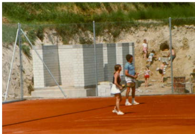
1982 der 3. Platz und die sanitären Anlagen werden in betrieb genommen