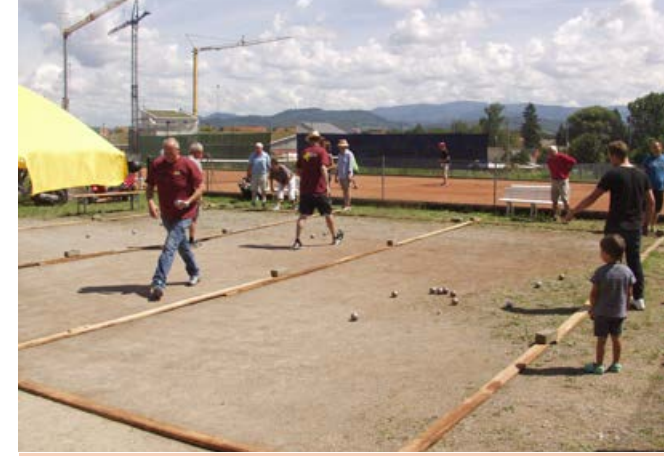
Spannende Wettkämpfe bei einem Bouleturnier