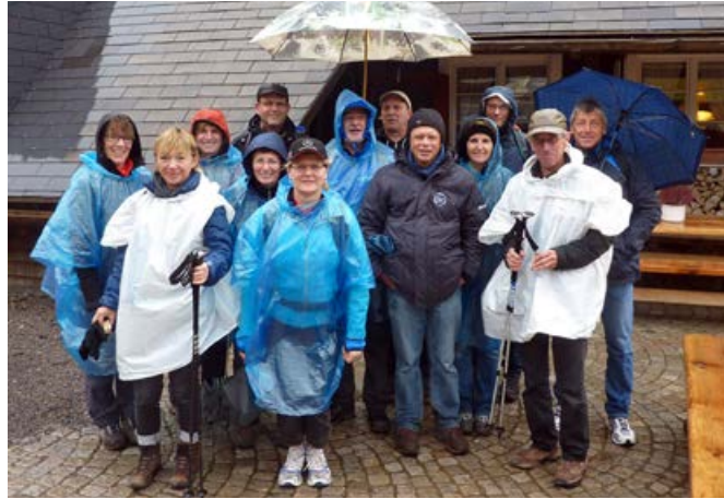
2013, Wanderung am Feldberg ... (leider verregnet)