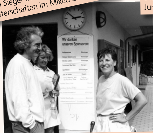
Ein kleiner Plausch nach dem Match