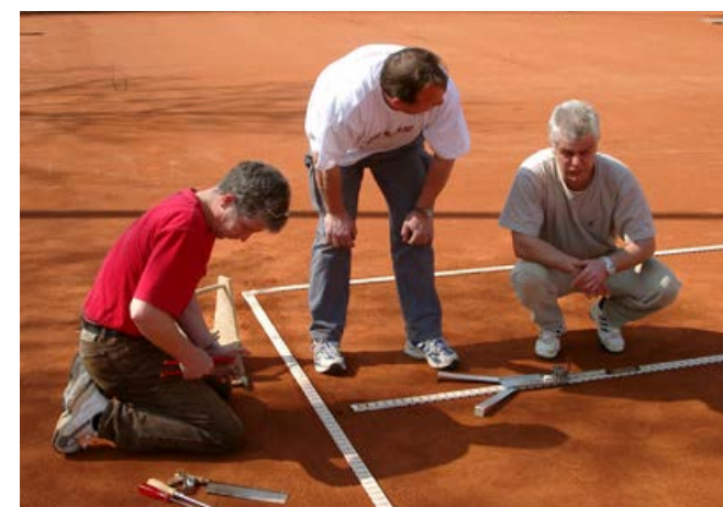
Die Linien werden neu ausgerichtet und gespannt

Seit zwei Jahren liegt diese wichtige Aufgabe nun in den Händen eines professionellen Fachbetriebs. Durch moderne Technik und fachliches Know-how erfolgt die Platzaufbereitung nun noch schneller, effizienter und auf höchstem Qualitätsniveau. Das Ergebnis: optimal bespielbare Plätze, die sowohl Hobbyspieler als auch Mannschaften begeistern – bereit für eine erfolgreiche und verletzungsfreie Saison!