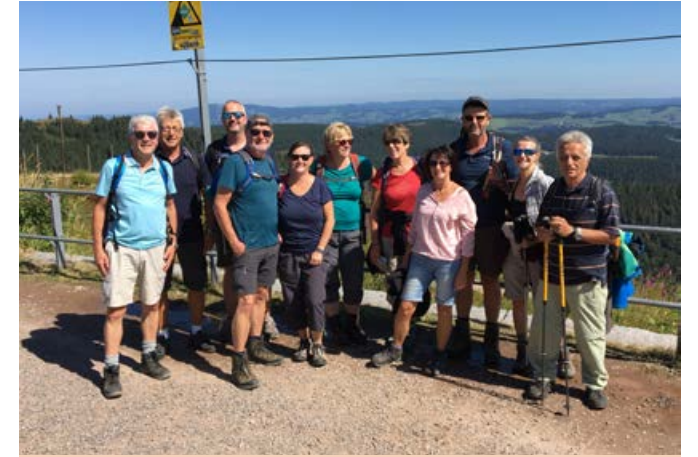
2019, Am Feldberg ist es doch am schönsten