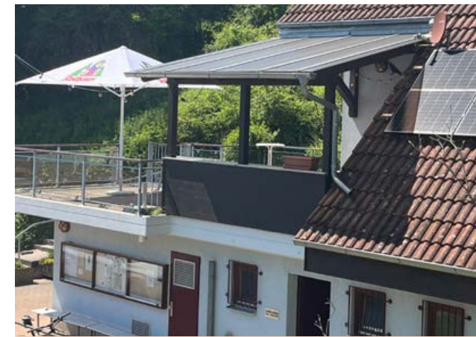
Die teilweise neue Überdachung der Terrasse ist fertig

Das 40-jährige Jubiläum wurde 2016 mit einem lockeren Sommerfest auf der Anlage gefeiert – inklusive Clubmeisterschaften und einem Bouleturnier. Durch eine teilweise Überdachung wurde der Aufenthalt auf der Clubheimterrasse attraktiver.