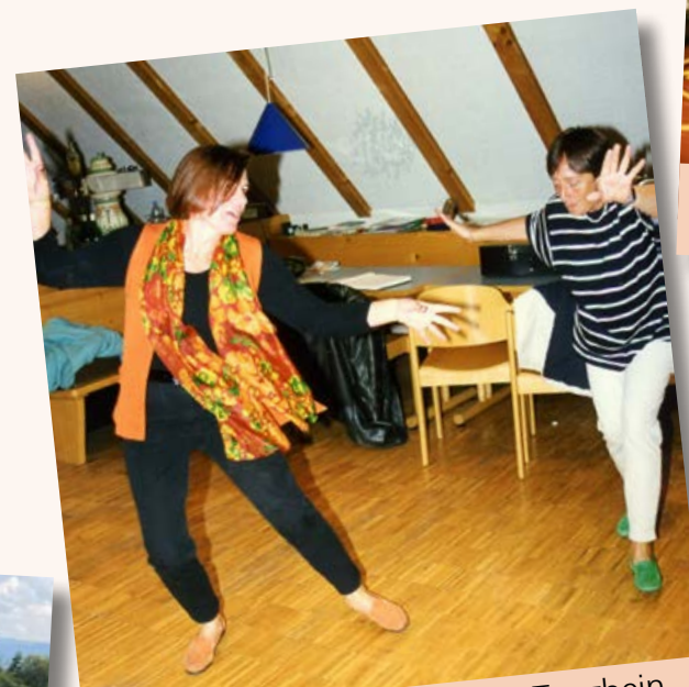
Abends wurde schonmal das Tanzbein geschwungen